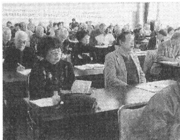
集会はくらし直結の活動を強調

こもりつきりでした。そんなとき、年金者の会の会員で元同僚がカラオケの席から電話で呼び出したところ、退院して間がなかったのか、ふらつきながら青い顔をして出てきました。「家に独りでいると落ち込んでしまうが、こうして仲間と一緒にいると、つまらない事は忘れてしまう」と、いまでは見違えるように顔色も良くなり、最近では、