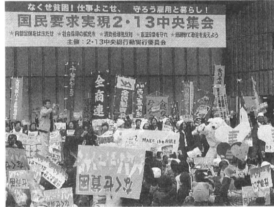
国民要求実現2・13行動には1万人が参加した

年金3%引き上げ要求と、月額8万円に満たない無年金、低年金者に生活支援金8万円支給を要求する運動の、最大の山場として3月19日、年金者組合の緊急要求「09年年金一揆」を国会周辺で行います。 首都圏から組織人員の10%、神奈川から900人が参加します。 3月19日(木) 12時、参議院議員面会所前集合。 集会後には