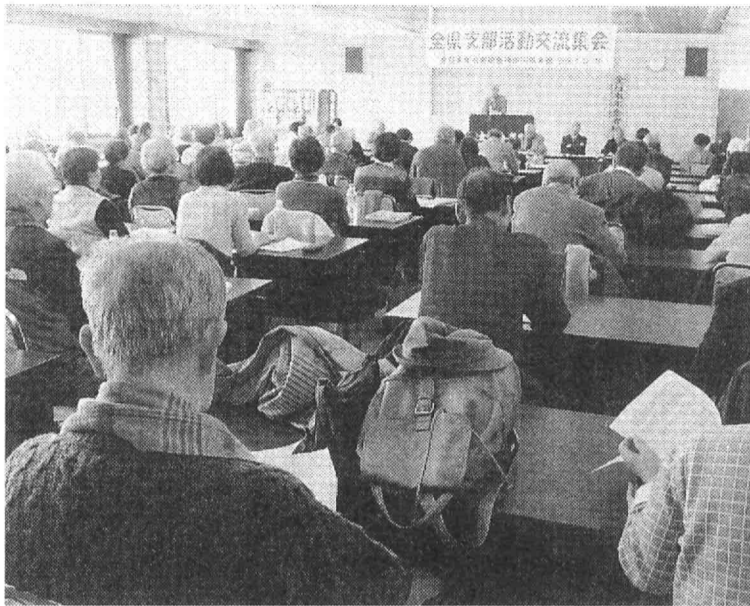
支部活動交流集会はこの春9500人実現に確信を持つ