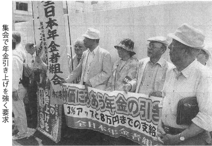
集会で年金引き上げを強く要求

〒170-0005 東京都豊島区南大塚1-60-20協立第3ビル TEL. 03(5978)2751 FAX. 03(5978)2777 発行人 篠塚多助 月刊1部100円 送料70円 昭和57年6月30日第三種郵便物認可