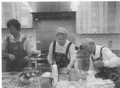
料理づくりは楽しいね

横浜みなみ支部第4回目の「みなみ料遊会」が7月28日、男性5人、女性4人で猛暑を乗り切る料理作りに挑戦しました。メニューは①天ぷら、②ソーメン、③納豆とホーレンソウの和え物、④キュウリ・ミョウガの漬物でした。 メインのかき揚げは、イカ、ホタテの甘さと触感と香葉が香ばしく、さわやかな一押し品の絶品でした。 パチパチ飛び跳ねる油に逃げ回り、後始末の苦勞も「男の料理」は大マカサが必要とおおらか。イカの身の皮ムキを忘れ