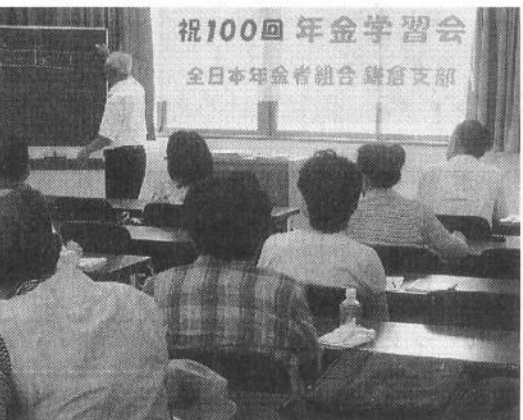
市民の間に定着した年金学習会

秋の仲間づくりでは何としても1万人の県本部を作る。この1点です。「暑さも去らぬうちにまた拡大か」の声が聞こえそうですが、私はそうは思っていない。1万人の大会を超えるということは要求運動を進める上で重大であり、そのためには、ただ加入者を増やせば良いということではないと思うからです。