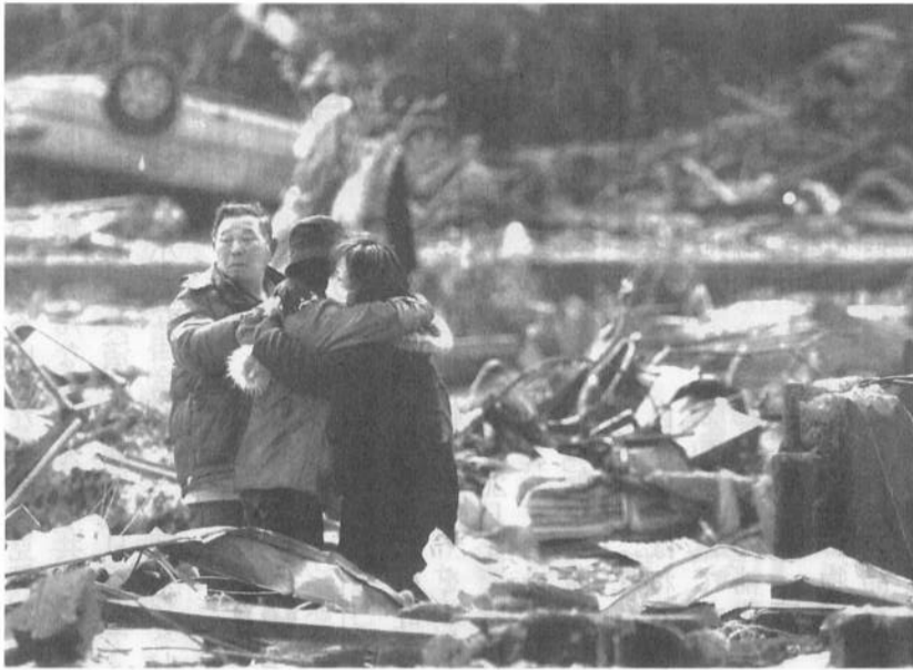
津波で破滅した町で、泣きながら抱き合う人たち (3月13日朝日新聞)

〒170-0005 東京都豊島区南大塚1-60-20天翔大塚駅前ビル TEL. 03 (5978) 2751 FAX. 03 (5978) 2777 発行人 篠塚多助 月刊1部100円 送料70円 昭和57年6月30日第三種郵便物認可