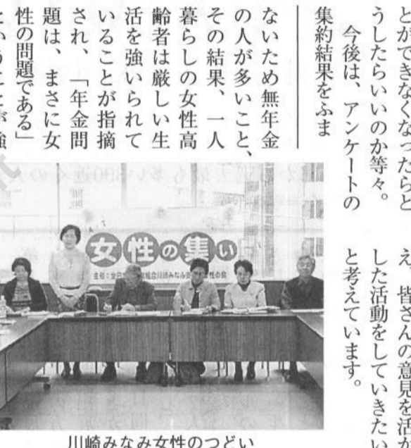
川崎みなみ女性のつどい