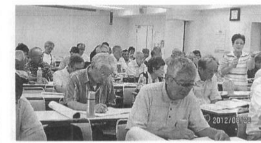
発言にも熱がこもる支部代表者会議

今回の会議の特徴は、拡大運動の新しい広がりをつくるために県本部にいくつかの機構を設けることが提案されました。一つは、「地域・高齢者に信頼される年金者組合づくり」の一歩として「自治体委員会」を設け支部の要求運動を援助します。二つは、飛躍的な拡大を保障する「県内すべての自治体に年金者組合をつくる」ことです。そのために「新支部独立委員会」を設置します。県内の自治体数は、19市28政令区、13町1村。その中で3政令区2市11町1村が空白です。三つ目は、県、支部に「年金相談室」を設け(公表、常設)の県本部が支部の相談