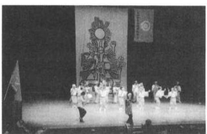
本場の阿波踊りに会場も沸く

1日目分科会は、春の女性実態調査後の活動を探りたいと「今風井戸端会議」に参加しました。京都宇治市の高齢者福祉