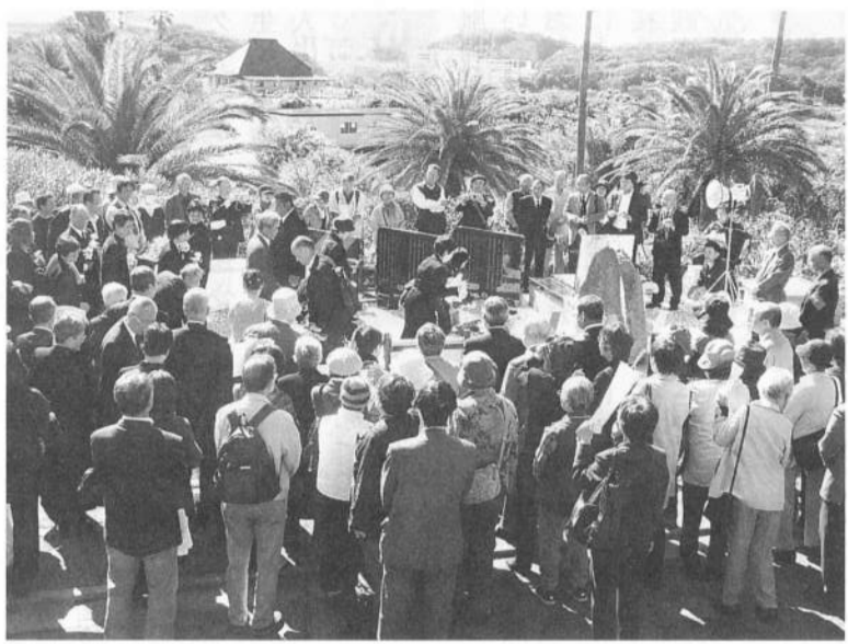
仲間が見守る中献花する遺族のみなさん

10月24日(水)秋の墓前祭が行われ250人が参加しました。秋晴れの下、11体が納骨され、遺族の方々が献花をし、参加者全員で、アコーディオン