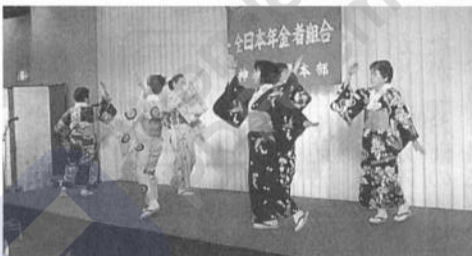
「郡上踊り」の鎌倉支部のみなさん

絶好の秋日和私たちの支部は組合墓地見学を含めてマイクロバスで出かけました。車中で納骨される方が、預けていた寺からの移動手続きに手間がかかったと話されていました。霊園に着き「わあこんな広いところいいね!」。墓前での代表のお話は「17年入退院をくり返し、その中で墓地を見学、皆さんに見守られて納骨が出来、妻も喜んでいまして」と。交流会は一変して遺族の方たちへの激励。きれいでいこの「郡上踊り」から、今期納骨された方のご家族から生前の姿などが話されました。支部からの感想に「とても心強い」と。それは、