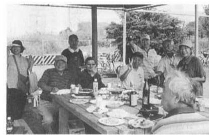
バーベキューを楽しむ寒川支部

9月の支部主催バーベキューに35人が参加し、大いに盛り上がり、そこで3人が入ってくれました。10月恒例の支部主催カラオケで1人、更にカラ