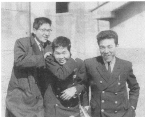
横浜税関の前で、右端が筆者

くると縄ばしごがよじれ、本船側に背中がきてしまいそれ以上登れない。縄ばしごを登るコツは、片方だけを両手で握ることだが、片方に体が寄るため怖いから、どうしても両手で両方を握ってしま