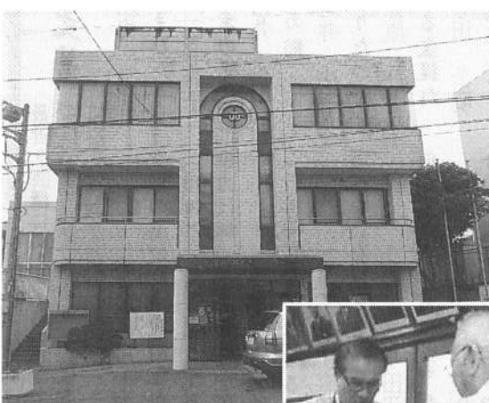
上: 三浦市勤労市民センター 右: 署名を渡す村本支部長(後ろ姿)

三浦市勤労市民センターは3階建て、エレベーターもあり、ロビーには各サークルの案内が多数貼られ、多くの人々に利用されているのが分かる。年金者組合は市民権を得たように三浦市の中核になり活動している。(青木昭弘)