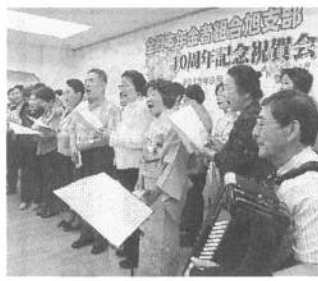
横浜旭支部の10周年、記念祝賀会が9月28日二サロンに来賓、組合員100人を集め、賑やかに開かれました。

2003年、保土ヶ谷瀬谷支部の仲間たちから独立後、異例の速さで2倍以上の450人、横浜で一番大きな組織になりました!!写真。