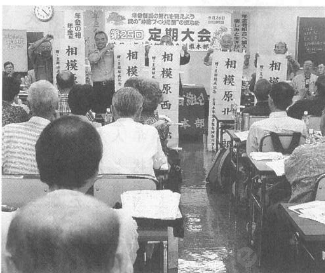
5つの支部に再編された相模原に「のぼり旗」が贈呈される(第25回定期大会)

湯河原、津久井など全 役員、傍聴者の数は県本部から駆けつけた代議員、部組合員1万578人を