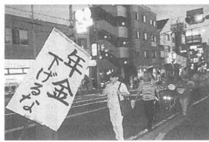
港北支部の5回目の街の一揆。大曾根・樽・大倉山地域

2003年、保土ヶ谷瀬谷支部の仲間たちから独立後、異例の速さで2倍以上の450人、横浜で一番大きな組織になりました!!写真。