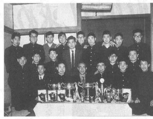
優勝した関東学生連盟選手権(前列右・私)