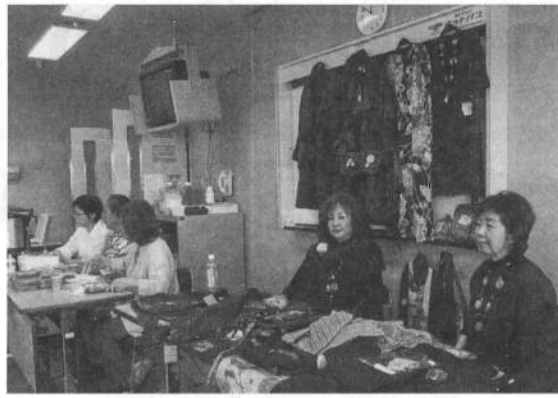
活動する旭支部女性の会のみなさん

女性高齢者生活実態の結果の冊子をもつて、3月中旬に区役所と話し合いました。年金者組合を知ってもらおうと名刺を作り、懇談に臨みました。高齢者支援担当係長は説明を聞いて、