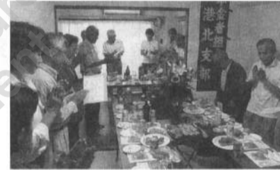
盛り上がった事務所開き

2分。マンション2階40㎡。家賃8万5千円。9月23日に、港北支部の事務所開きには、「念願」かなった喜びでいっぱい。友誼団体、組合員が