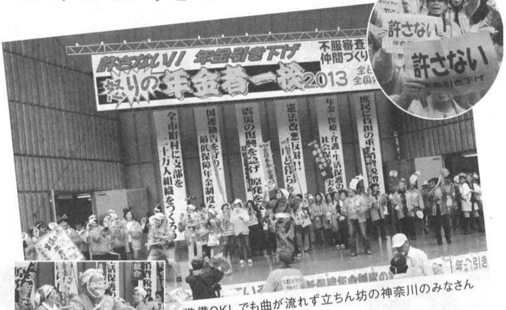
準備OK! でも曲が流れず立ちん坊の神奈川のみなさん

年金の事や消費税、思っていることはみんな同じだなと感じました。とにかくパワーがあつて、