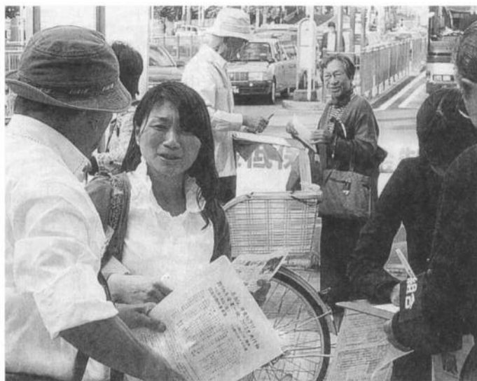
年金支給日宣伝に汗を流す青葉支部の仲間(あざみ野駅)

年金支給月の10月16日、横浜青葉区にあざみ野駅前、年金者組合の仲間たちが「10月からの年金削減は不当だ」取 り消しを求めて不服審査請求運動を始めている」と道行く人たちに訴えま した。これは、支給日宣伝が