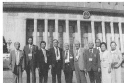
抗日戦争記念館前で(中国、2005年)

八路軍は規律がしっかりし人間を特に女性を大事にする、仕事を真面目にする、嘘をつかない」との教育を受け辛い事は無かったです。