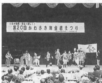
第20回かわさき年金者まつり

10月5日(土)、かわさき年金者まつりが市民プラザで開かれました。雨天にもかかわらず329人の組合員が集い、舞台では全支部が日頃の練習の成果を披露していました。役員の準備、連携もよく、川崎支