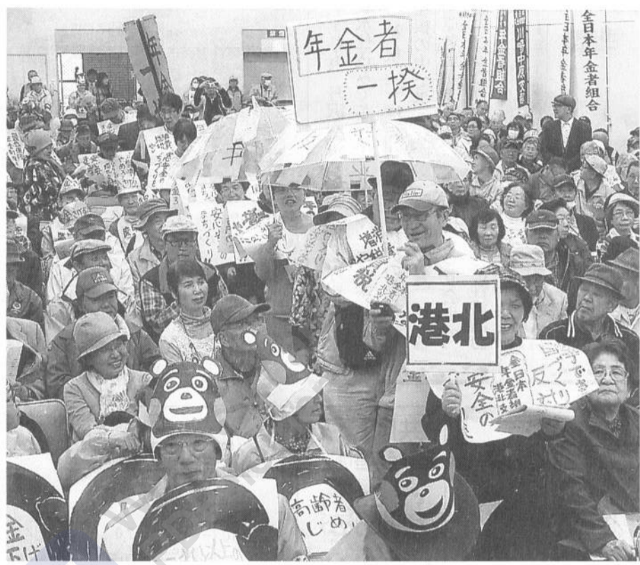
「街の一揆、やめられない」港北支部の仲間が会場をネリ歩く (4月1日)