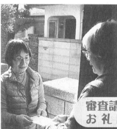
審査請求の お礼訪問

良き時代はるか 遠くに行きにけり 年金額が3年連続 夫婦で7万円も減額さ れ、4月から消費税が 8%になり、暮らしを 見直さざるを得ない時 にきています。父の共 済年金をもらっていた 母が「給料が上がると 年金も上がるからあり がたいね」と話してい