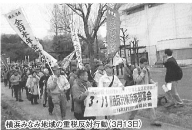
横浜みなみ地域の重税反対行動(3月13日)

あきらめず運動強く 鎌倉支部 3月13日、全国重税反対行動の鎌倉集会は、雨模様の中、鎌倉商工会議所でおこなわれました。くらし・雇用・営業を守れをスローガンに集い、消費増税阻止をあきらめず運動していくことを確認し、各組織の決意表明のあと、税務署までデモ行進をしました。