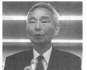
土志田県本部委員長

年金事務所が遠く相談にも不便な地域や、年金者組合の支部づくりの機運を盛り上げるために、「年金(相談)キャラバン」がスタートしました。5月8日、二宮町、町民センターでの「年金相談会」には、チラシを見て来た5人が訪れ、その後「勉強会」には地元の組合員、平塚支部女性会、23人が集まりました。II写真上。