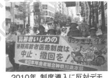
2010年、制度導入に反対デモ

75歳以上の「後期高齢者医療制度」の保険料が、この7月から、9万164円（平均）になります。80%を超える圧倒的な方たちは値上がりとなる仕組みです。東京都に次いで2番目に高い保険料です。 制度ができて6年。この間、9276円も引き上げられました。 3月に審議した「広域連合議会」では、自民、