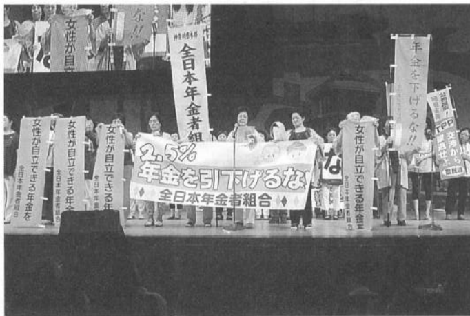
年金者組合も壇上から訴えた