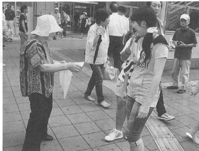
話を聞いて駆けよってきた中学生。記事は3面(8/15小田原駅前)

東日本大震災支援の同行記 「必要がある限り一人 近はほとんど一人で続けられても続ける」と信じています。今度も自分の畑で採れた各種の野菜、竹細工サークルの作品を軽トラに積み、義援金や衣類を石巻市の年金者組合やボランティアに届けました。