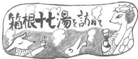
題字 茅ヶ崎支部 藤田香代子 ▶5◀