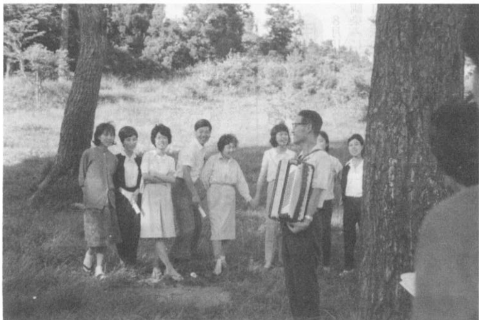
うた声が公園にこだまして(アコが夏野さん)