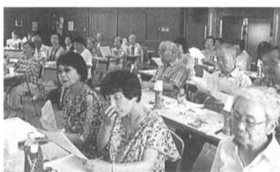
なんと51人も集まった総会

いに笑顔でいっぱいでした。第1部総会。13年度活動報告、14年度新役員提案まで順調に進み、拍手で承認されました。意見として「集団的自衛権を歓迎している県知事に抗議文を出してはどうか」「すべて楽しく、元氣の