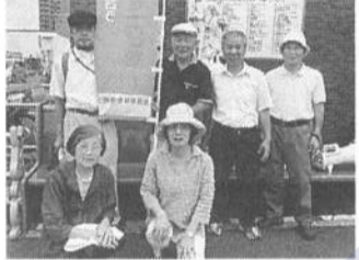
宣伝終わって皆でパチリ

この男性は支部チラシを見て加入し、1月の新入組員歓迎会に参加。「病気の治療で、しばらく行事には参加できません」と言う事でしたが、支部新聞を読んで、8月酷暑のなか、駆けつけてくれたのです。