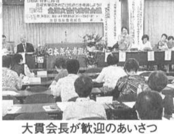
大貫会長が歓迎のあいさつ

年金者組合「全国女性代表者会議」が、9月25、26の両日、横浜で開かれ47都道府県すべてから女性の会・部の会長、部長130余人が集まりました。開催地神奈川の女性の会は貢献しました(詳細次号)