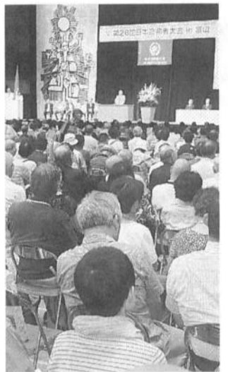
5300人集まった高齢者大会

全国から延べ5347人が集まって、9月12、13の両日、富山県で開かれた「第28回日本高齢者大会」は、「戦争しない平和な日本をつくる」決議を採択し、来年の開催地、和歌山に大会旗を引き継ぎました。神奈川からは、年金者組合、民