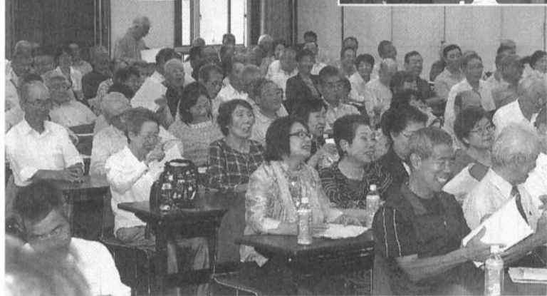
右上、あいさつする土志田委員長。下は笑いと拍手の会場