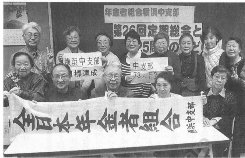
直訴署名も仲間増やしも達成し、喜びの総会(11月29日)

秦野市ではいま曾屋地区で特別養護老人ホーム(定員100人)の建設工事が進んでいます。秦野支部は、増え続ける「特養老人ホーム待機者を何とかしたい」との