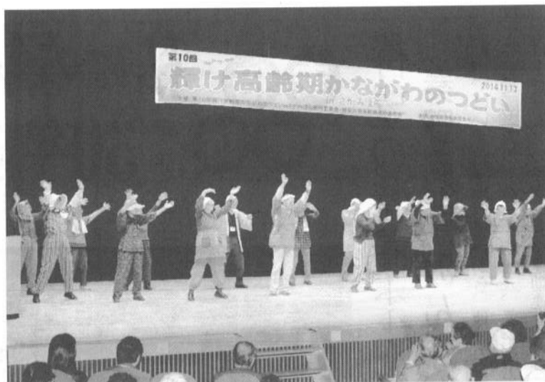
爆笑につく爆笑。つよい盛り上げた年金者組合