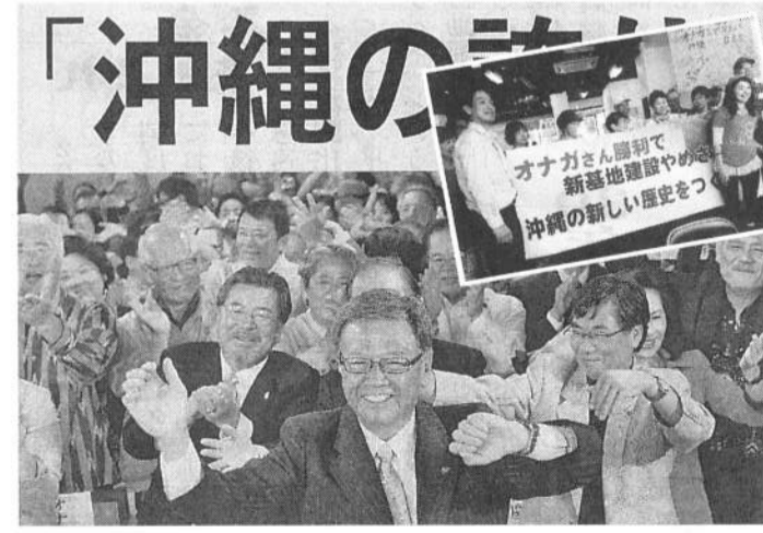
当選伝える地元紙、支援の人々(文、写真、新聞とも井澤さん)