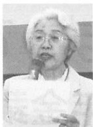
発言する小早川女性の会事務局長