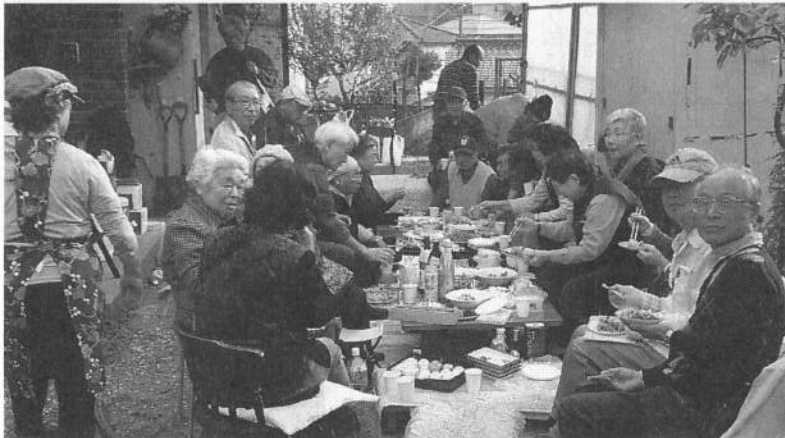
仲間が集まる行事をつくる(イモ煮会・緑支部)