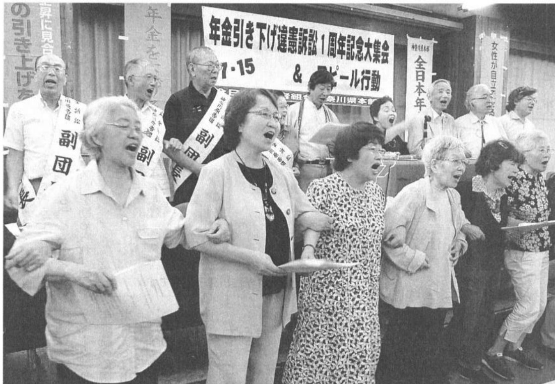
感動の合唱!! ガンバロー (7月15日、横浜市従会館)

年金引き下げ違憲訴訟 1周年記念の集いが7月15日、どしゃ降りの横浜 駆けつけた250人の原