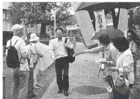
最高裁前での要請行動 (7月26日)