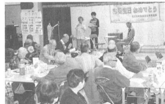
楽しいお誕生会、港南支部

「神奈川共同墓所」開設5周年記念事業でふたつの事業が進められています。1つは「納骨室」壁面4分の1を使った「壁画」です。2つは、5周年記念誌の発行です。A4判30ページ。完成が待たれます。