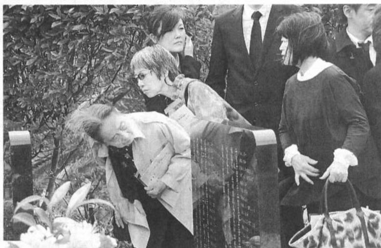
墓誌に家族の名前を探す参列者(写真上) 墓碑(写真左)