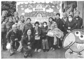
森永の製菓工場に行く

支部には俳句と小物づくりの2サークルだけ。無趣味の人ばかりかというと然に非ず。絵、書、民謡、踊り、津軽三味線、大正琴、謡曲、ハーモニカなど多士済々です。「一堂に会してやってみよう」と、昨年五月に「演芸会」を実施。会場は逗子高齢者センターのステージつき大広間。2回目の11月には出し物も2倍に増え、