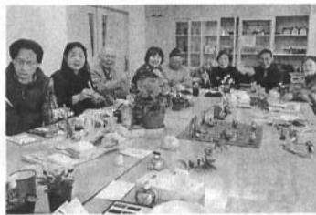
活躍する絵手紙サークル