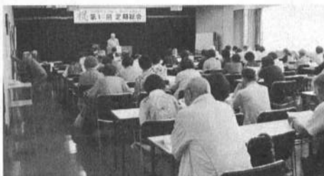
町の幹部も出席する愛川支部総会

目標達成し2度目の上積みを考えています。この1、2年達成できず気になっていた。今回、新年会で踊って