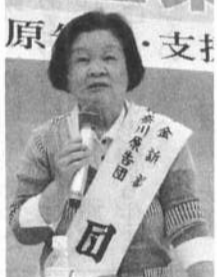
怒りをこらえて裁判長に訴えた加藤団長