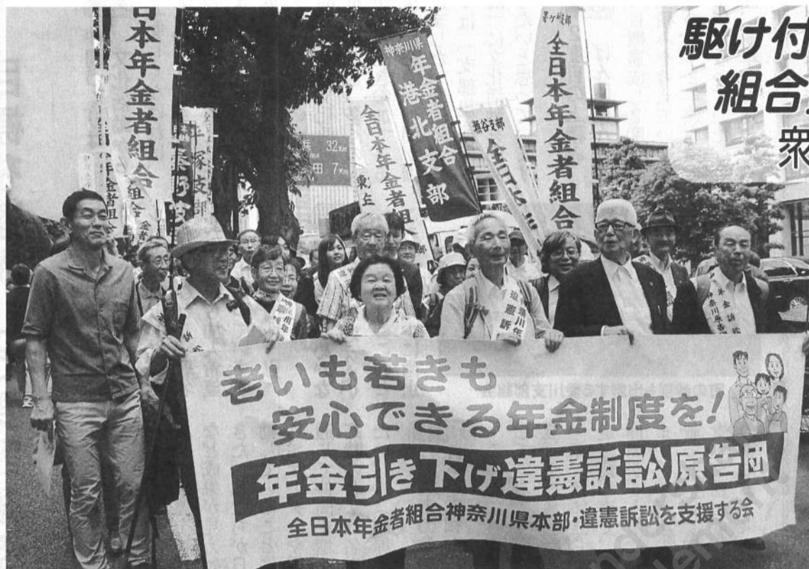
勇気凛々、東京地裁に入る原告団