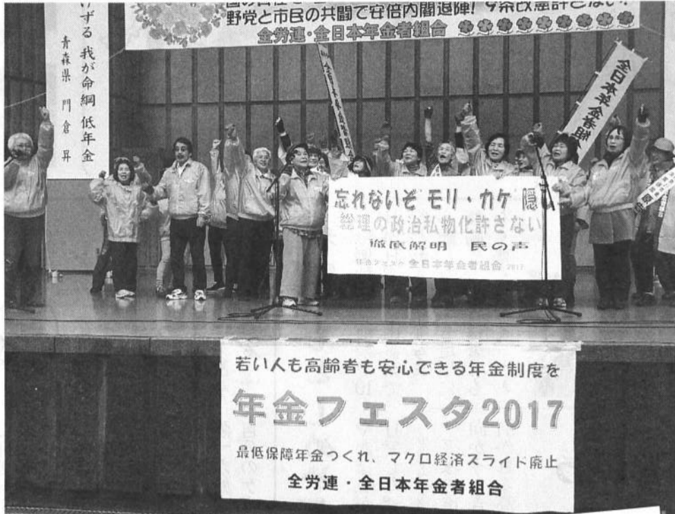
きよしのズンドコ節を踊り会場を沸かせた神奈川女性の会