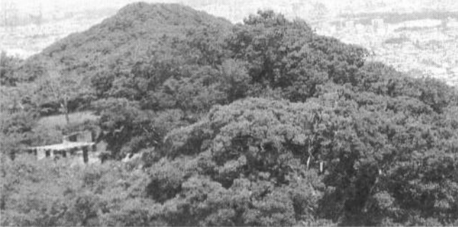
湘南平より高麗山・平塚市街を望む