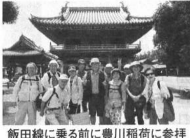
飯田線に乗る前に豊川稲荷に参拝