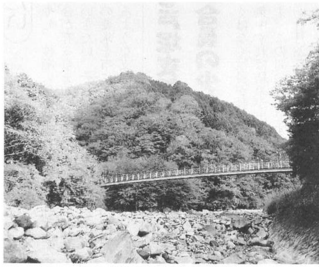
西丹沢の溪流に架かる吊り橋

下棚、本棚とつづく滝ふたつ 西丹沢の谷を打ちおり た。 ところで五年ほど前でしたか、秋晴れの朝に思い立って西丹沢へ