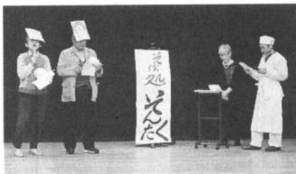
川崎年金者まつりに出演した宮前支部

人生遊びに始まり遊びに終る、遊びは人生を豊かにし、私たちの「社会活動」をも豊かにしてくれます。