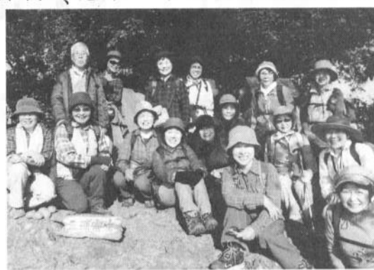
旭支部16人の仲間と(三浦富士にて)

に丹沢と箱根・伊豆、ふり向けば房総の山並など、見飽きることはない。行程のどの砲台山には、愚かな戦争の砲台