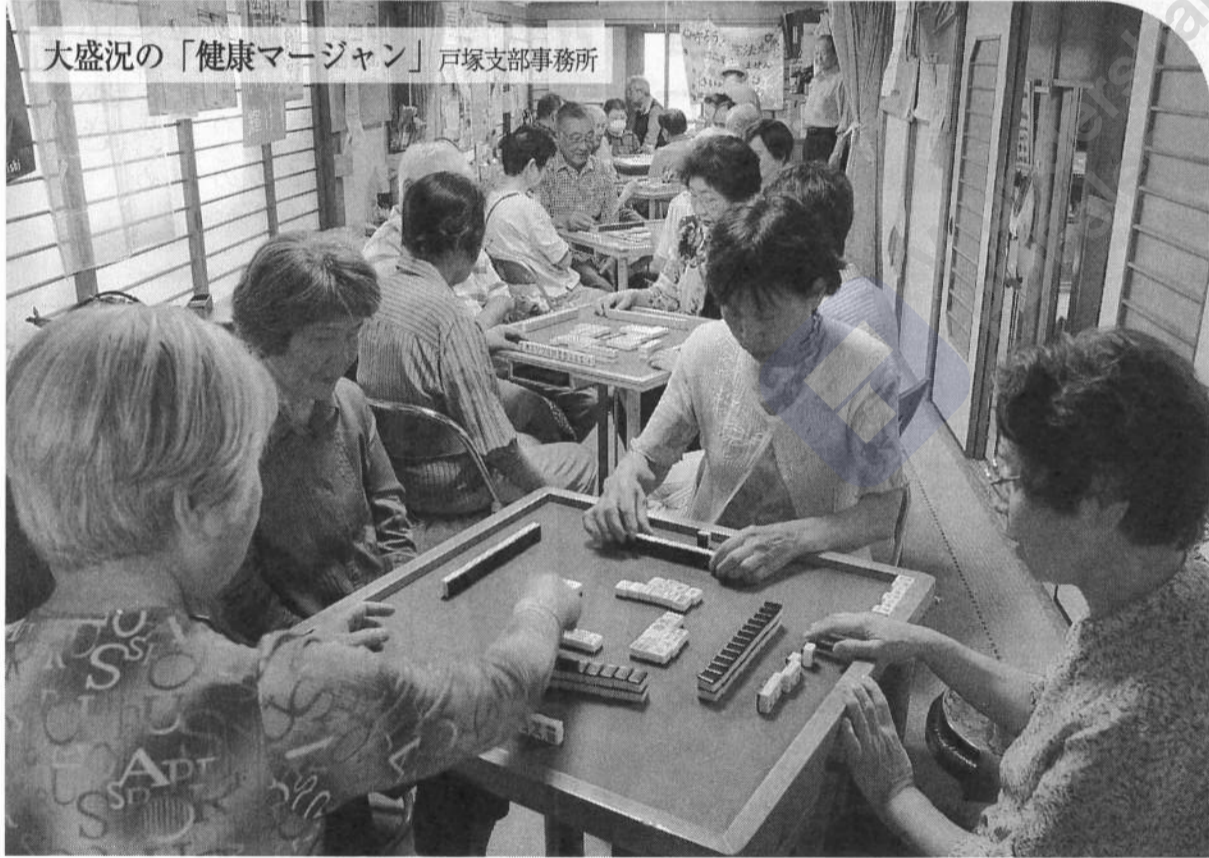
大盛況の「健康マージャン」戸塚支部事務所

んでくれました。「久しぶりに笑ったり大きな声で歌ったりして元気が出た、楽しかった」と話してくれました。さつそく、年金者組合の加入をお誘いしました。9月に発足した支部の編み物サークルにも誘ったら参加したいと言っています。「ひとりぼっちにならなくてよかった」年金者組合はすばらしい所ですね。(津久井・下田愛子)