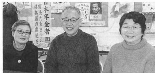
左から伍女性の会会長、杉沢委員長、村田書記長