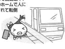
電車で出動途中、駅のホームで人に押されて転倒