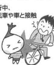
歩行中、自転車や車と接触

今年の7月から今までの自転車保険を廃止し、新たに個人賠償責任保険と交通災害共済の取り扱いを始めます。