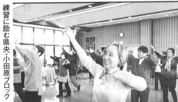
練習に励む県央小田原ブロック

参加。体力に合わせたコースを歩きました。体力が衰えて参加できない人が出ているのが心配です。(下田繁志)