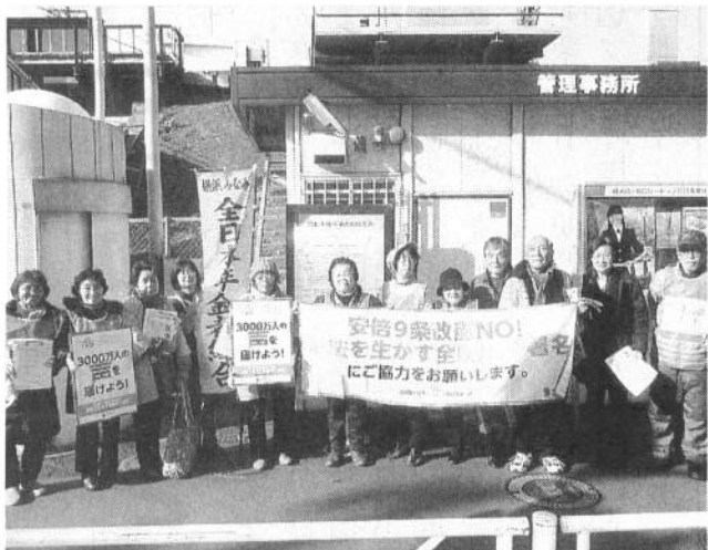
年金支給日に3千万署名。横浜みなみ支部の皆さん (2/15 京急井土ヶ谷駅)

☆憲法共同センターとユナイテッド(野党共闘を求める団体)の「安倍改憲NO30000署名」桜木町行動」に県本部役員が参加しました。「憲法9条変えないで」チラシ、3万枚を全県各支部で地域に配っています。