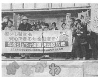
集会で訴える年金者組合

春の県民集会 組合61人参加 3月4日・日、神奈川県労働主権の「県民集会」神奈川県反町公園で開かれ、組合から61人、千人が参加しました。