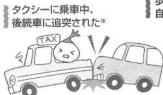
タクシーに乗車中、後続車に追突された*