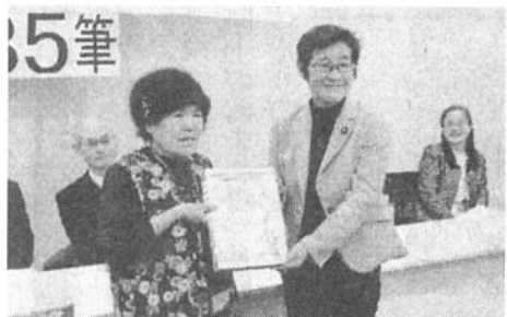
新年金署名21万筆を共産党倉林参院議員に渡す

2月28日現勢 組合員 10,700人 機関紙 6,488部 新署名 13,227筆