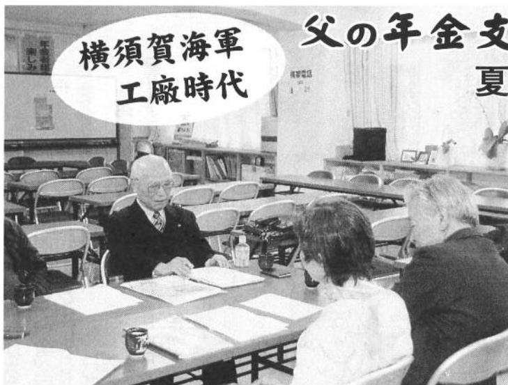
横須賀海軍工場時代

好 奇心 ギリシヤ神話に登場するあらゆる邪悪を防ぐという主神ゼウスの持つ盾の名と、陸地といった意味の迎撃ミサイル「イージス・アショア」、政府は(2基2000億円)導入を含む防衛費の18年度予算案過去最大の5兆1911億円を決定。また、社会保障費削減の見込み、医療・介護の更なる削減を計画。2月に決定した「高齢社会対策大綱」は、高齢者の就業促進・年金支給開始年齢70歳超の選択を検討・健康寿命の2歳以上延長や介護離職ゼロを目指すほか、ロボット開発促進・住宅セーフティネット制度や高齢投資家の保護などと盛り込まれた。大綱は「全世代型社会保障」への転換と称して、世代間を分断し、高齢者を標的にした改悪と言わざるを得ない。自助努力を求め個人型確定拠出年金の普及、年金削減や「年金カット法」の実施、医療・介護の自己負担増で高齢者が苦しんでいる状況を抜本的に改善する対策にはほど遠い。▼高齢者にこそ「ゼウスの盾」が必要である。それには、年金削減の仕組みを撤廃し「最低保障年金制度」をつくり、医療・介護の充実で安心して老後の生活を送れる対策を講じるべきだ。(妖光)