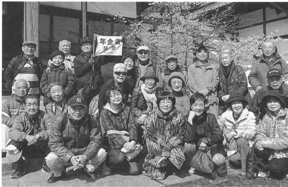
緑・青葉・都筑 3支部合同のウォーク

チラシを2500枚撒いたところすぐ反応があり、3～4人加入。民謡をのぞきに来た方も入会。しかも自分も踊りもできて教えられ、またひとつサークルが増えそう。短い間に6人が入会。でもサークルだけではない良さも広げなければ、共済・お墓・前進座など