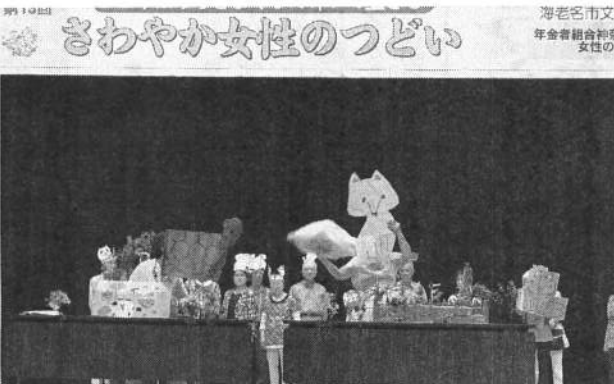
舞台いっぱい跳んだりハネたり「ウサギと亀のその後」(川崎麻生支部)

「女性の会」への見方を180度変えてくれた。地に足をつけて生きることを学ばせてもらい大変感謝しています。