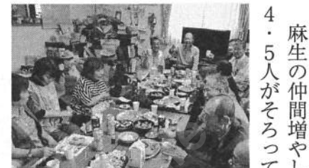
新加入の歓迎会(川崎麻生支部)

麻生の仲間増やしは4・5人がそろって各家をまわり、加入を促す。役員会や定例のつどいで対象者をあけて役員ですすめに行くのですが、沢山で訪問すると「こんなに沢山来て下さるなら入らなくっちゃ」と入会してくださる方が多い。今回は里山活動での知り合い、駅頭