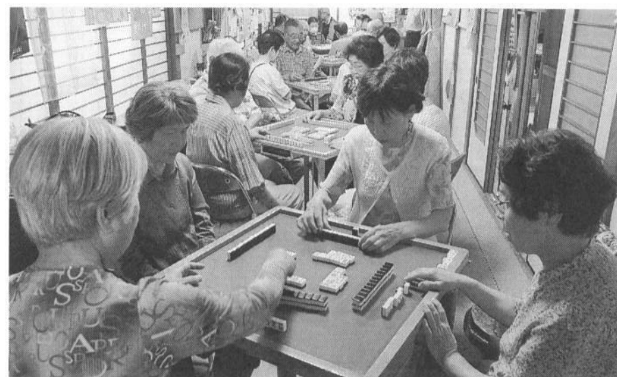
定例月5回、6卓でいつも満員!他に月4回ほど実施(戸塚支部事務所)