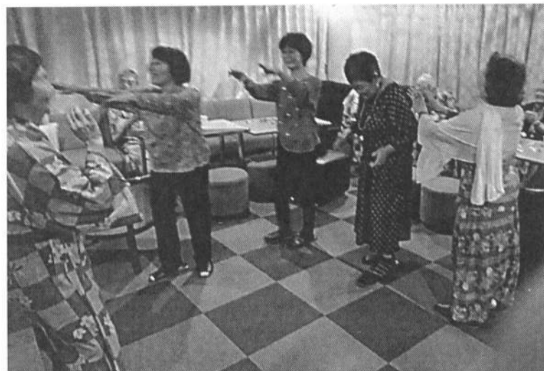
飲み放題、食べ放題の後はみんなで楽しく(カラオケ室)

横濱市の敬老バス制度(横浜市敬老特別乗車制度の見直し)が検討、審議会が始まっています。横濱市の敬老バスは2013年10月から施行され、多くの高齢者の足になり、お金の心配がなくバスを利用しています(便利なフリー