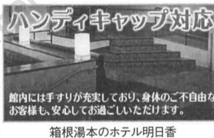
館内には手すりが充実しており、身体のご不自由なお客様も、安心して過ごいただけます。

箱根湯本駅から徒歩で七分のことですが、私たちはホテルさし向きの車で、満開で大輪の紫陽花を目にしながら、急な坂を上っているなど感じたらもう「明日香」でした。私は4部屋、3帖くらいの日本間もついでいて、バリアフリー仕様のせいか、ゆったりしていました。前方に広がる大きな窓から、これから箱根の山へ向かう登山電車が山間の