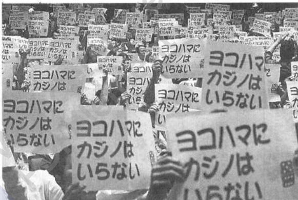
「カジノはいらぬ」1200人集まる

横浜市は、敬老パス（敬老特別乗車証）について利用者が増えて、民間バス・市営ともに負担が増えるとして値上げを検討しています。「敬老特別乗車制度あり方検討会」を設置、年内の答申、値上げをめぐっています。 敬老パスは高齢者がバスに乗り街に出て元気に活動することが、介護や病気の予防につながる地域経済にも寄与する制度です。「敬老パス負担増を考慮する連絡会」では、