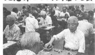
第10回年金者組合囲碁大会は8月11日「ヴェルクよこすか」で80人の参加で開催されました。写真。