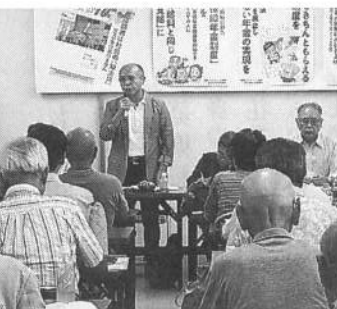
激励に駆けつけた廣岡本部書記長

原告弁護団は、意見陳述書で国は財産権の侵害に当たらないとの反論について年金制度は国民全員の生活を維