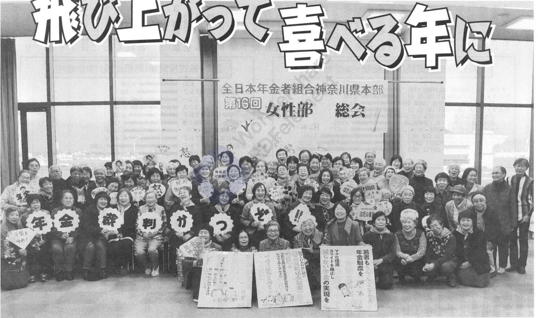
全日本年金者組合神奈川県本部 第16回 女性部 総会