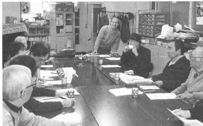
春の月間を話し合う役員会

下船の行程が伝わら ず、夜中に不安で目が 覚めるようになり、も はや限界に達していた。 バルコニーに出ると両 隣の部屋から咳き込む 音が聞こえる。 翌日、自衛隊の医療 班がPCR検査の検体 を採取に来室したが、