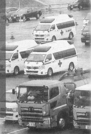
港にズラリ並んだ救急車

2月19日夫と共にクルーズ船 ダイヤモンド・プリンセス号を 下船しました。新型コロナウイルス による感染で横浜港に隔離され た組合員から「不安と恐怖」の 体験を寄稿していただきました。 沖繩を出港してから たが、ここまで乗り越 船は速度を速めて横浜 えてきた。患者が数十 港に入港した。香港で 人出て、ふ頭に救急車 下船した中国人がコロ が並んだ。搬送に1日 ナウイルス陽性だった 以上かかる とのことで隔離が始ま のは不思議 った。 だったが、 連絡は政府からでは 受け入れ先 なく、船長のアナウン の病院を打 スだった。 診しながら 持病の高血圧の薬が の搬送だっ 届かず鼻血が出たりし たようだ。