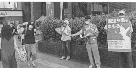
再開できた茅ヶ崎支部の宣伝

港北支部 生活保護申請しているが、高齢者の貧困が、コロナ禍で益々酷いことになっている。