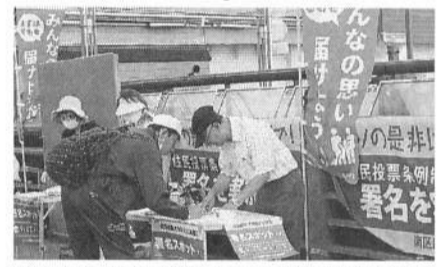
弘明寺商店街で横浜みなみ支部も「カジノ署名」

残暑厳しく、台風の影響で突然の雨が降った9月、署名、宣伝行動が県内各地で行われ、9月19日、神奈川支