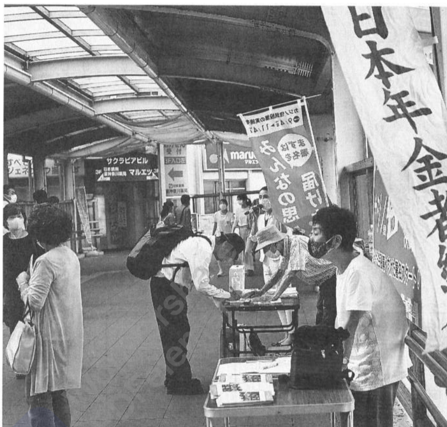
いつものJR東神奈川駅通路で「カジノ署名」(神奈川支部)