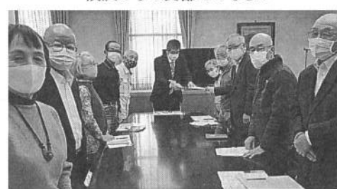
県に要請書を渡す役員のみなさん

■年金相談会 1月12日(火) 午後1時~4時30分、県本部事務所 事前に電話いただければ幸いです