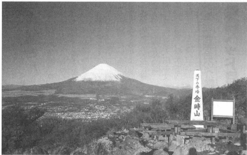
南足柄から一望できる風景