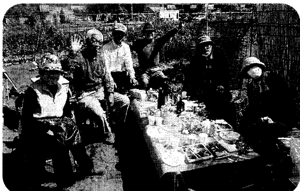
13人加入で全県1番の達成(茅ヶ崎支部) 撮影のためマスクを外しています

5月31日現勢 組合員 9,909人 機関紙 6,053部 2021年緊急署名 1,947筆