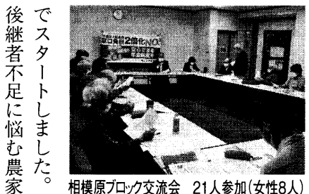
相模原ブロック交流会 21人参加(女性8人)

「最近TVの音を大きくしないと聞こえない」「話が聞きづらくなってきた」という人が増えてきています。補聴器が高額なので購入できないで我慢している人も多くいます。