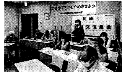
川崎ブロック 馬場目中央副委員長も参加

5月27日川崎ブロック交流集会在行われ、男性16人、女性7人が参加。「仲間増やしはエサをまいて声かけを」の発言に「エサって？」の質問。「老人会、グラウンドゴルフ、里山活動でつながりを」との返事に納得の声。さあいっぱいエサまきしよう！