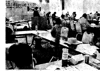
県北・湘南・三浦ブロック会議(3分散会)34人参加

鎌倉支部の年金学習・相談会の230回はただ頭が下がります。組合員に要求アンケートをやってみよう。