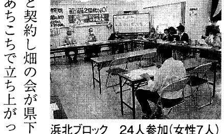
浜北ブロック 24人参加(女性7人)

「最近TVの音を大きくしないと聞こえない」「話が聞きづらくなってきた」という人が増えてきています。補聴器が高額なので購入できないで我慢している人も多くいます。