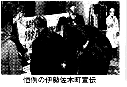
恒例の伊勢佐木町宣伝

「最近TVの音を大きくしないと聞こえない」「話が聞きづらくなってきた」という人が増えてきています。補聴器が高額なので購入できないで我慢している人も多くいます。