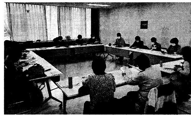
津久井支部 新婦人の会との合同会議