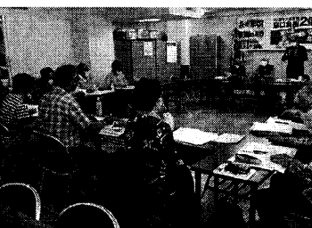
浜西ブロック会議 女性も積極的に発言

コロナのことで後ろ向きになってきている支部もありですが、女性パワーを信じてください。叩かれる者ほど強くなるのですから。女性の年金について、もっと男性に分かつて欲しい。改めて原点に戻っ