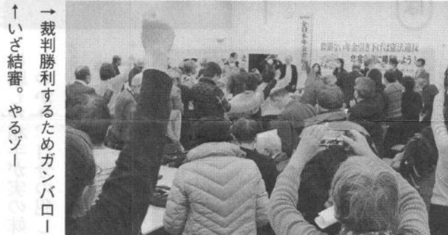
→裁判勝利するためガンバロ！ いざ結審。やるゾー