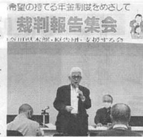
希望の持てる年金制度をめざして 裁判報告集会

2/28年金者組合中央本部 露大統領に向け抗議声明 ウクライナ侵攻に断固抗議するとともに 軍事作戦を直ちに中止し、即時撤退を求める 2月24日、ロシアはウクライナへの軍事侵攻を行った。ウクライナ東部地域の住民を守るためとしているが、このことは、明らかに国連憲章に違反する行為であり、断じて容認できない。すでに戦禍はウクライナ全土に広がり、ロシア軍はチェルノブイリ原発を掌握し、ウクライナの首都キエフに迫っている。 ロシア国防相は「民間人は脅かさない」としていたが、軍事施設への攻撃にどまらず、民間人の犠牲者も出し、多くのウクライナの人々は国外へ脱出するなど、基本的な人権や生存する権利等が脅かされている。軍事的行為はいかなる理由があろうとも、許されるものではない。 また、プーチン大統領が24日、「ロシアは、今や世界で最も強力な核保有国である」「ロシアへの直接攻撃は侵略者の壊滅と悲惨な結果につながる」と述べ、戦争を体験した組合員も数多くおり、戦争の悲惨さを身をもって体験している者として、また、広島と長崎への原爆投下を受けた日本国民として、現下のプーチン政権によるウクライナ侵攻と核兵器使用宣言に対して強く抗議し、即時撤退とともに、ウクライナの人びとの人権を尊重し、平和的手段による問題解決を行うよう、ロシア政府に強く申し入れる。