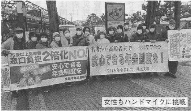
女性もハンドマイクに挑戦

2月28日現勢 組合員 9,634人 機関紙 5,963部 2022年緊急署名 655筆