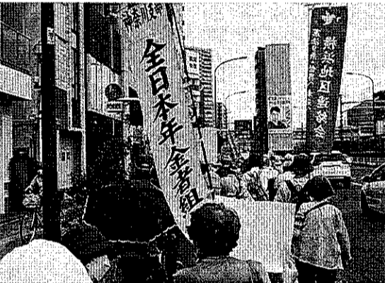
9-15神奈川3区、革新と共同の会と賛同して 神奈川支部

「安倍元首相国葬反対」「憲法違反の国葬は中止しろ」の声が高まる9月27日、安倍元首相の「国葬」が強行されました。国会周辺には「国葬」に反対する団体、市民1万5000人が結集しました。この間、多くに地域で国葬反対の集会・パレードが行われ、国葬反対の世論を高めてきました。9月19日、代々木公園で1万3000人の集会が開かれました。「国葬」は直ちに中止の行動広がる