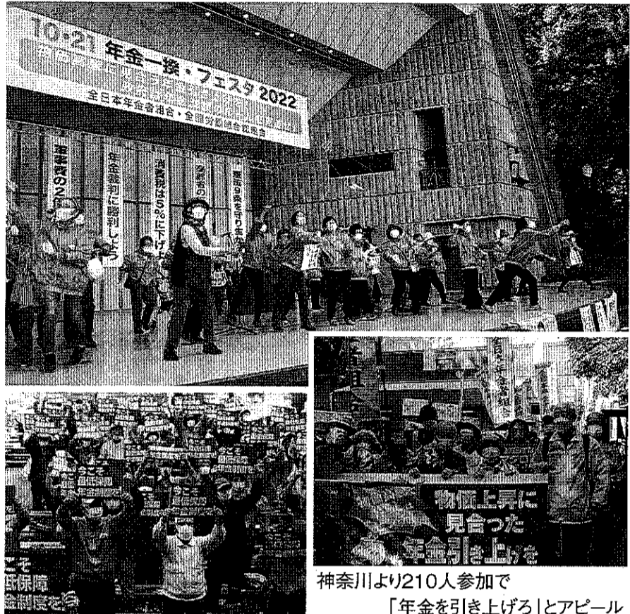
神奈川より210人参加で 「年金を引き上げろ」とアピール

奈川県は、「365日の紙ヒコキ」の音楽に合わせ踊り、最後に紙ヒコキを会場に飛ばし、会場を盛り上げました。 主催者あいさつで、全日本年金者組合の杉澤隆宣中央執行委員長は、物価高騰のなかでも今年度の年金を削減し高齢者の医療費負担を増やした岸田政権に