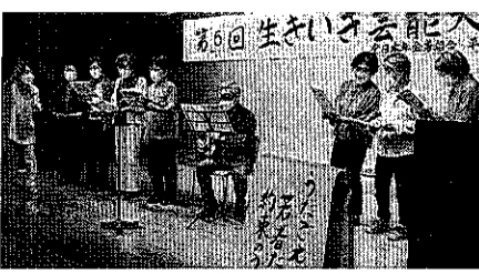
平塚支部の「生きいき芸能大会」

12月13日(火) 午後1時~4時、県本部事務所 事前に電話いただければ幸いです。