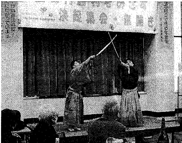
前進座による「立ち回り」