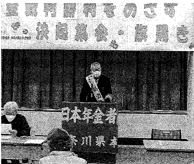
「仲間と支援者を増やし、裁判の勝利を」と金井原告団長