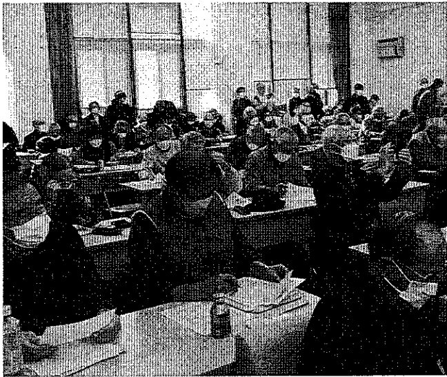
会場に入りきれず立ち見をする原告団の仲間