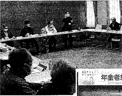
分散会で活動報告する参加者