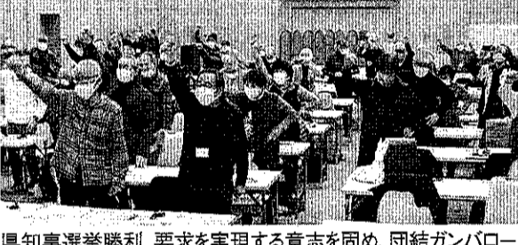
県知事選挙勝利、要求を実現する意志を固め、団結ガンバロー