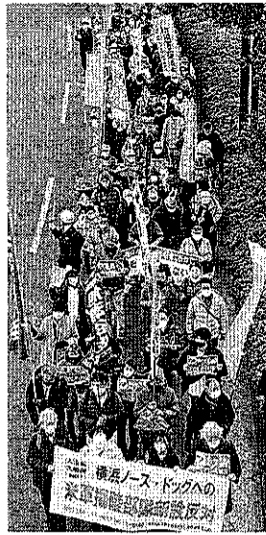
デモ行進する参加者ら

「横浜港のど真ん中を米軍の出撃拠点にするな」。横浜市桜木町駅で18日、県内の平和団体らの主催で、米軍施設「横浜ノース・ドック」(同神奈川県)への米軍揚陸艇部隊配備に反対するデモ行進が行われ、約500人がシユプレヒコールを上げました。