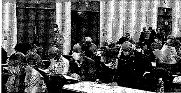
決意を固め、陳情書類を確認しあう仲間

員提出行動では倉林明子、木村伸子、宮本徹(日本共産党)の3人の議員が直接署名を受け取ってくれました。立憲民主党からもメッセー