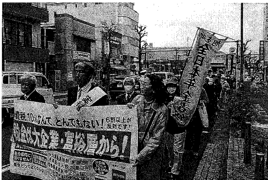
保土ヶ谷税務署行動には保土ヶ谷支部、旭支部から大勢がデモ行進

重税反対全国集会 54回目となる3・13重税反対全国統一行動が13日、全国各地で取り組まれました。重税と強権的な徴収に反対し、納税者自身が自主申告の権利を使い、民主的税制・税務行政の確立を求め集会やデモ、集団申告を行いました。政府は2023年度から5年間で軍事費を43兆円にしようとしています。その財源として年金、介護などの社会保障費の削減、インボイス(適格請求書)実施で景気を悪化させようとしています。今年の大綱には増税や負担増に反対する運動を抑