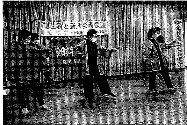
楽しく元気な年金者組合